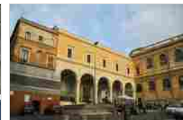
BASILICA DI SAN PIETRO IN VINCOLI ROMA