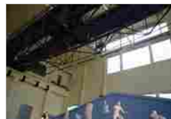
FRONTONE DEL TEMPIO DI APOLLO SOSIANO CENTRALE MONTEMARTINI